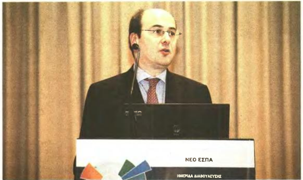
Τα βασικά σημεία του νέου προγράμματος «Επανεκκίνηση» παρουσίασε χτες ο Κ. Χατζηδάκης

Σύμφωνα με τον κ. Χατζηδάκη, το βάρος για πρώτη φορά πέφτει στην επιχειρηματικότητα και την καινοτομία όπου και θα κατευθυνθεί το 25% του συνολικού προϋπολογισμού με πόρους που θα ανέλθουν σε περίπου 4 δις. ευρώ ως το 2020. Αντίθετα τα υπόλοιπα προγράμματα παίρνουν αναλογικά, μικρότερο μερίδιο: το Περιβάλλον και οι Μεταφορές 24%, η Εκπαίδευση -Κατάρτι-