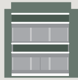
Ιδιωτική Εκπαίδευση - Κοινωνική Μέριμνα