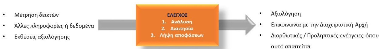
Σχήμα 3-1: Σύστημα Παρακολούθησης Χρηματοοικονομικού Μέσου

Προκειμένου για την καλύτερη δυνατή παρακολούθηση του ΜΧΤ, κρίνεται σκόπιμο να οριστούν τα επίπεδα παρακολούθησης μεταξύ των δομών που θέτουν σε εφαρμογή και υλοποιούν το ΜΧΤ. Το σύστημα παρακολούθησης του ΜΧΤ συνίσταται σε τρία επίπεδα: